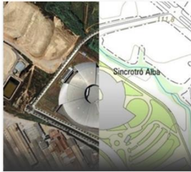
Plans i programes ↗