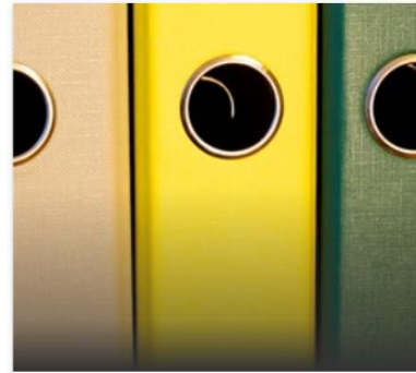
Participació pública ↗