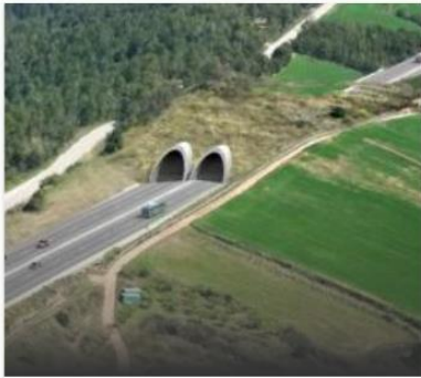
Projectes d'infraestructures ↗